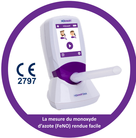
La mesure du monoxyde d'azote (FeNO) rendue facile