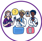
Forum exclusif NObreath®