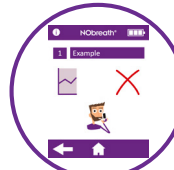
Créer et enregistrer des profils de patient