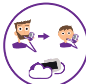
Modes d'échantillon pour adultes, enfants et ambiant