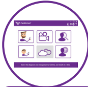
GRATUIT – FeNOchart™ logiciel pour la gestion des patients